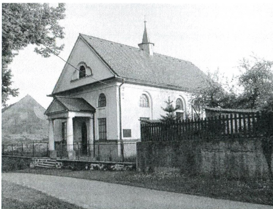
Modlitebna ve Střížově