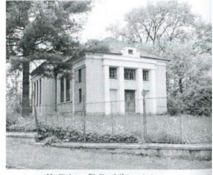
Modlitebna v Blažkově (foto autor)