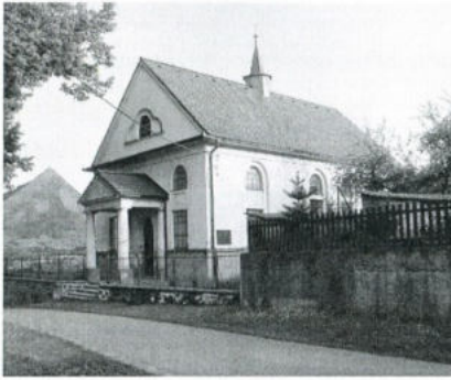
Modlitebna ve Střížové