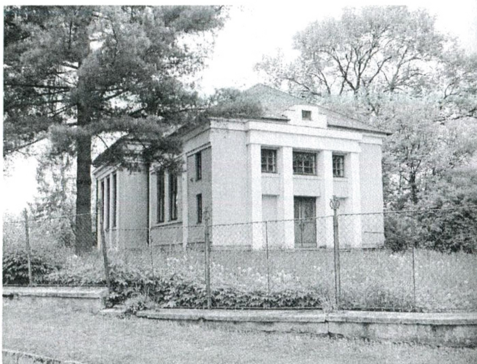
Modlitebna v Blažkově