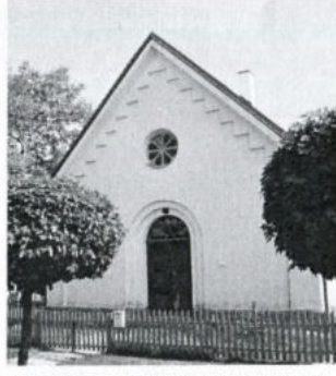
Modlitebna v Nové Včelnici